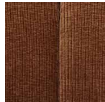
Tissu côtélé tissé brun rouille