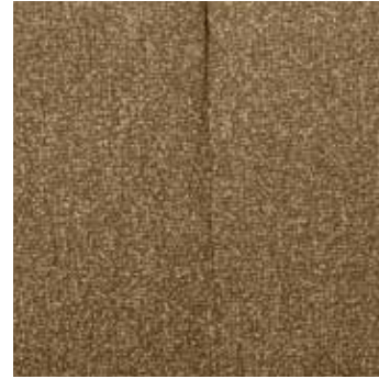
bouclé mélangé jaune/brun