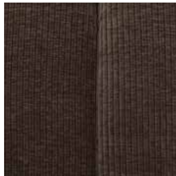
Tissu côtélé tissé brun