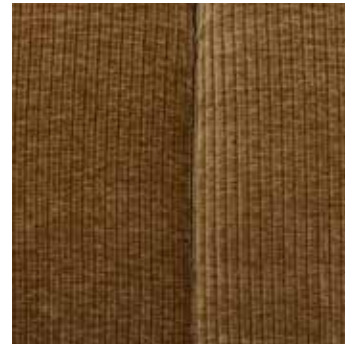
Tissu côtélé tissé jaune miel