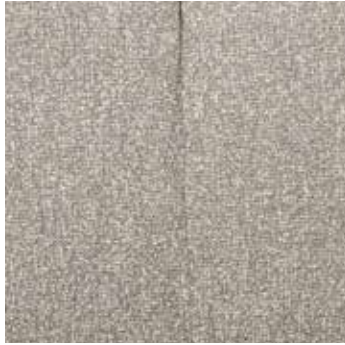
Bouclé mélangé beige