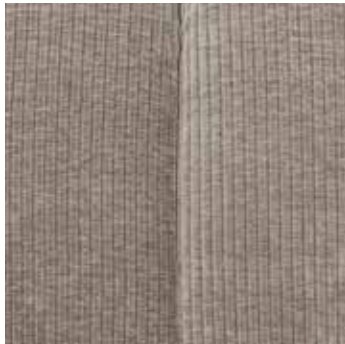
Tissu côtélé tissé sable foncé