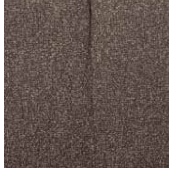
Bouclé mélangé brun