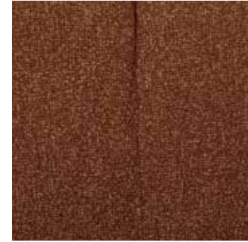
Bouclé mélangé brun rouille